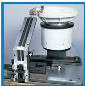
Vibratore per l'alimentazione di ganci da 70 mm.