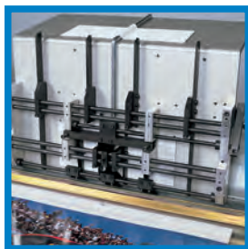
Alimentatore per ganci da 100 a 500 mm.